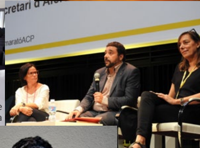
Departament i ACRA