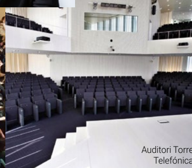
Auditori Torre Telefónica