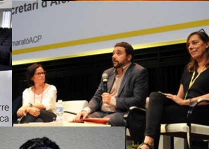
Departament i ACRA