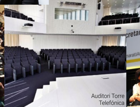
Auditori Torre Telefónica