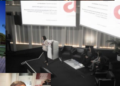
Jornada ACP 2018